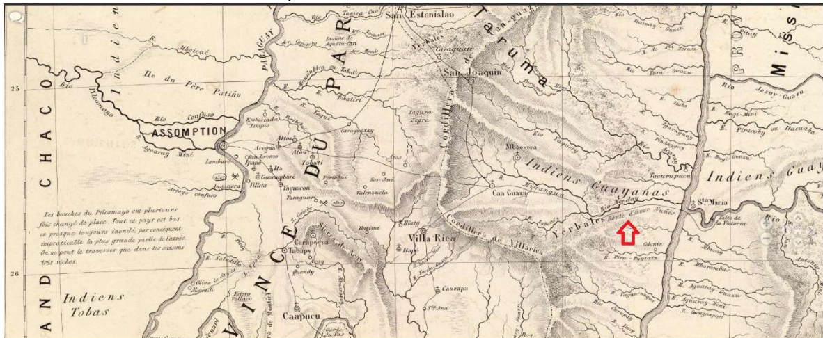
Figura B: Trazado probable ramal paraguayo Tape Aviru Asunción- confluencia ríos Iguazu Paraná. Al sur del Monday.

MOUSSEY, Martin de 11 , en 1865 publica el plano indicado en la Figura B 12 a continuación. Se visualiza un ramal del TAPE AVIRU que va paralelo y al sur del río Monday. Con inicio en las cataratas del río Iguazu cruza en la confluencia del Monday con el Paraná, pasa por Caaguazú y ahí se bifurca en dos ramales uno con destino a Villarica/Caazapa y otro con destino a Asunción. El autor indica en el plano “ Route d’ Alvar Nuñez”.