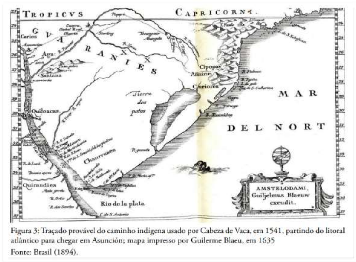
Figura 3: Traçado provável do caminho indígena usado por Cabeza de Vaca, em 1541, partindo do litoral atlântico para chegar em Asunción; mapa impresso por Guilherme Blaeu, em 1635

PALLERADA indica; en varias figuras, estudios sobre la presencia del sendero en la triple frontera y su entrada al Paraguay. A continuación en la figura A un mapa donde se registra el ingreso de Alvar Nuñez Cabeza de Vaca; vía un ramal en la zona de los ríos Monday y Acaray, hacia Asunción. El plano impreso en 1635 tiene inconsistencias sobre las coordenadas de ubicación geográfica de las tres fronteras, producto de errores en la medición o transcripción. Es claro en la representación que en la confluencia del río Iguazú en el río Paraná pasaba el camino.